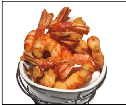
COLAS DE GAMBAS FRITAS 14,90 Fried red prawns