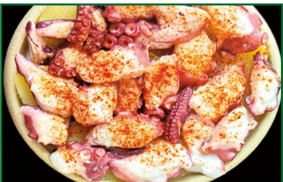
PULPO A LA GALLEGA 18,90 Galician octopus