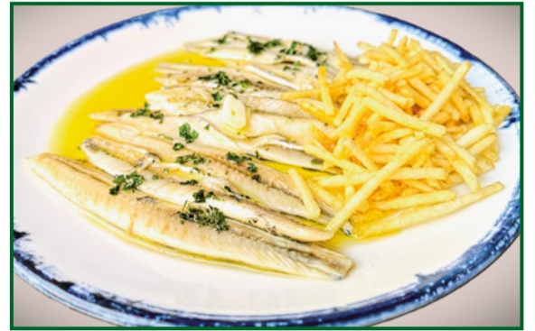
BOQUERONES EN VINAGRE 9,90 Anchovies in vinegar