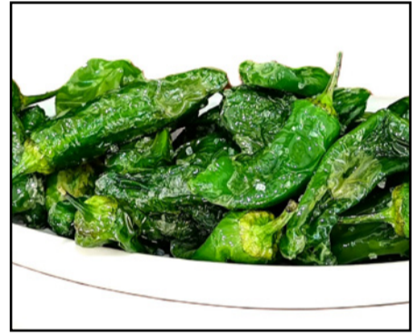
PIMIENTOS DE PADRÓN FRITOS 9,50 Fried Padrón peppers