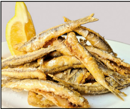
BOQUERONES FRITOS 10,90 Fried anchovies