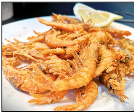
GAMBITA ROJA FRITA 15,50 Fried red prawns