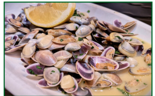
TELLINAS AL AJILLO 13,50 Garlic cockles