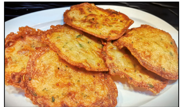
TORTILLITAS DE CAMARONES 13,50 Shrimp "Tortillitas"