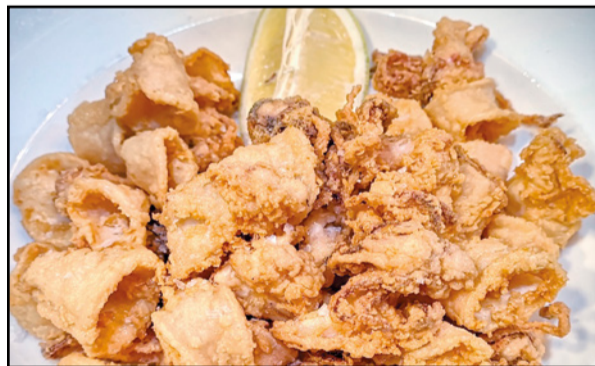
CALAMARES REBOZADOS A LA ANDALUZA 14,50 / Battered squid rings