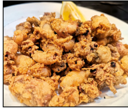
PUNTILLAS 13,50 Fried Baby Squid