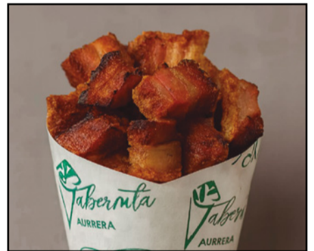
TORREZNOS FRITOS 14,50 Fried pork tails