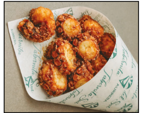
PULPO FRITO 18,90 Fried octopus