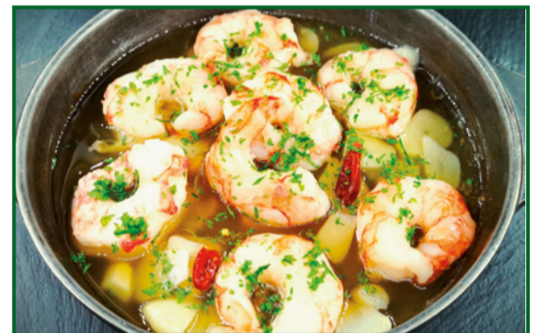
GAMBAS AL AJILLO 14,90 Garlic prawns