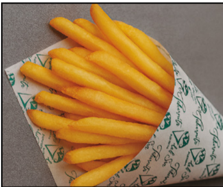
PATATAS FRITAS 7,50 Chips