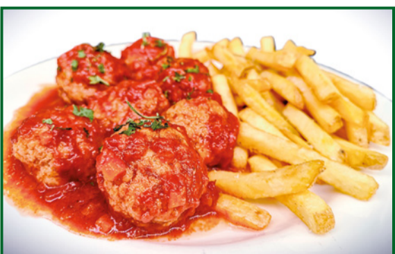
ALBÓNDIGAS CON PATATAS FRITAS 10,90 Meatballs with fries