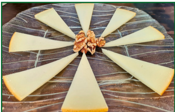
QUESO IDIAZABAL 11,90 Idiazabal cheese