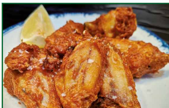
ALITAS DE POLLO AL ANDALUS 11,50 Chicken wings Al Andalus