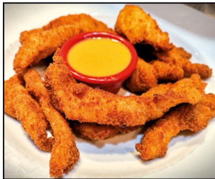
LAGRIMITAS DE POLLO 11,90 Chicken fingers