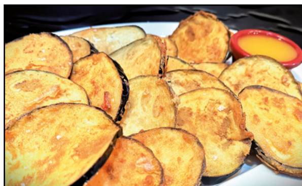
BERENJENA FRITA CON MIEL DE NÍSPERO 9,90 Fried aubergine with loquat honey