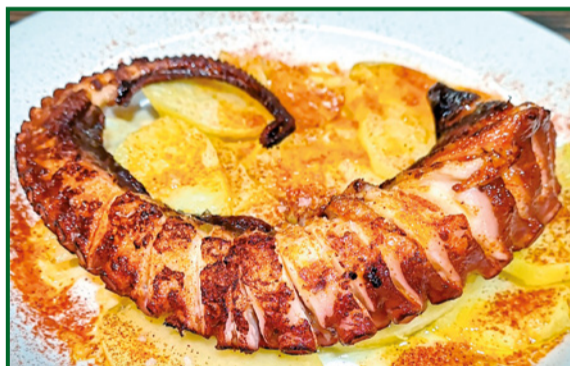
PULPO A LA PLANCHA 23,90 Grilled octopus