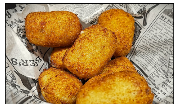
CROQUETAS DE JAMÓN 10,90 Ham croquettes