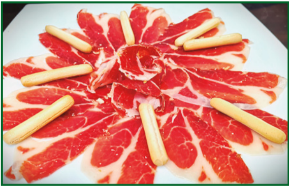
JAMÓN IBÉRICO DE BELLOTA 22,00 Acorn-fed iberian ham