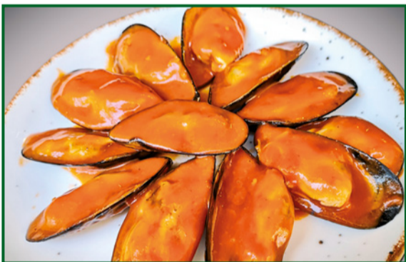
MEJILLONES TIGRE CON SALSA PICANTE 10,50 "Tiger" mussels with spicy sauce