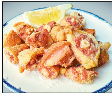
RABITOS DE CERDO FRITOS 10,90 Fried pork tails