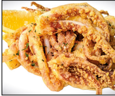
REJO FRITO 10,90 Fried Rejo (fried fake octopus)