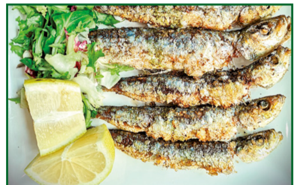
SARDINAS 12,90 Sardines