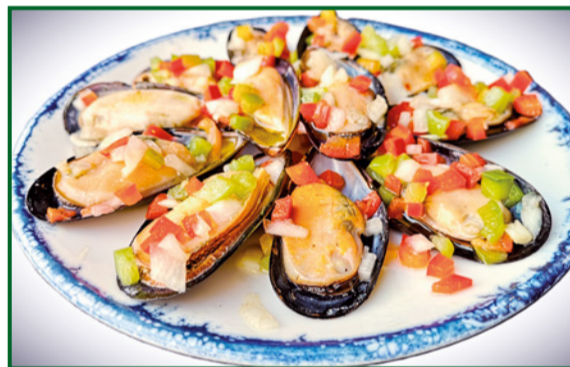
MEJILLONES VINAGRETA 10,50 Vinaigrette mussels