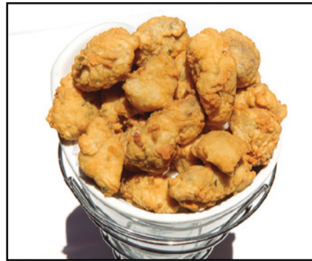
CAZÓN EN ADOBO 11,50 Marinated dogfish