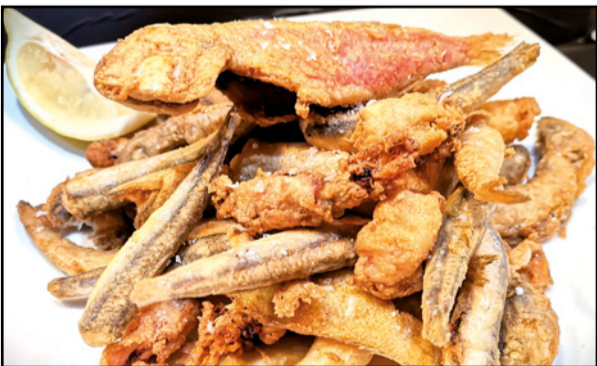
FRITURA DE PESCADO DE LA LONJA DE VILLAJOYOSA 21,90 / Mixed fried Fish