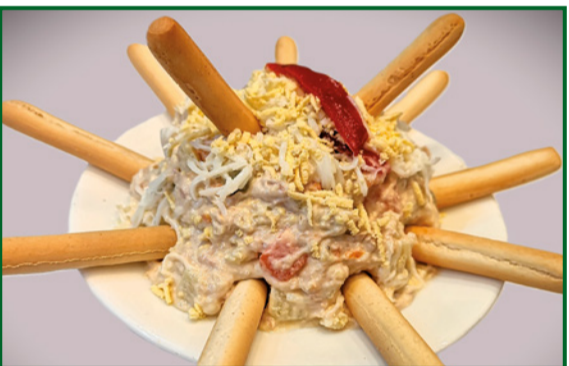
ENSALADILLA CASERA 8,50 Homemade rusian salad