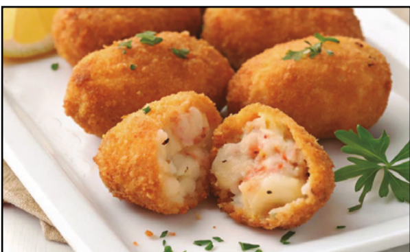
CROQUETAS DE GAMBAS AL AJILLO 10,90 Garlic prawns croquettes