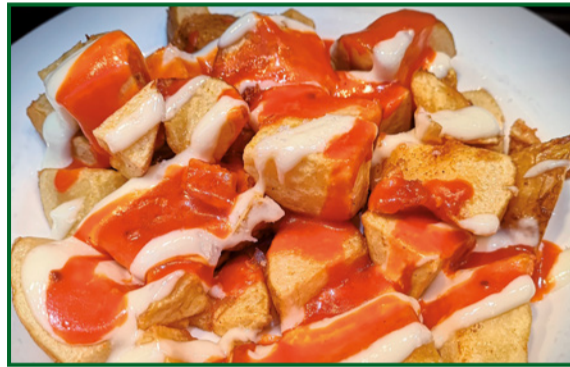
NUESTRAS BRAVAS 8,50 Spicy potatoes "Bravas"